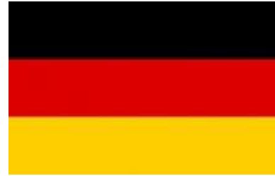
IM ALTEN SEZIERSAAL

Május 5. (Kedd) 14:30 –18:00 Május 7. (Csütörtök) 15:00 –18:00 Május 8. (Péntek) 14:00 –18:00